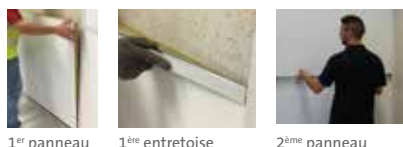
1 er panneau